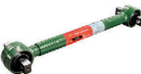
Штанга реактивная LC211008

SCANIA 1 486 757 SCANIA 1 485 758 SCANIA 1 782 023