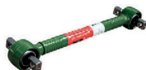
Штанга реактивная LC211018

81.43220.6151 81.43220.6183 81.43220.6276 81.43220.6277 81.43220-6390