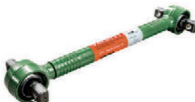
Штанга реактивная LC211005

DAF 0 267 743 DAF 1 361 649 DAF 1 361 650 DAF 1 656 428