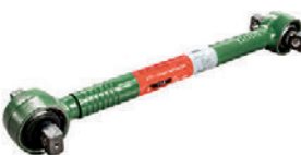
Штанга реактивная LC211009

SCANIA 1 499 474 SCANIA 1 722 746 SCANIA 1 906 940