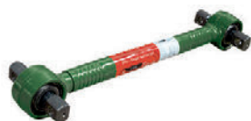
Штанга реактивная LC211003