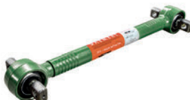
Штанга реактивная LC211004

MAN 81.43220.6129 MAN 81.43230.6030 MAN 81.43230.6014 MAN 81.43220.6096 MAN 81.43220.6098 MAN 81.43220.6097 MAN 81.43220.9096 MAN 81.43220.9129