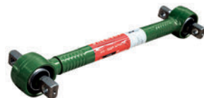
Штанга реактивная LC211013

74 22 076 170 20 410 530 20 509 018 20 517 494 20 374 444 70 371 270