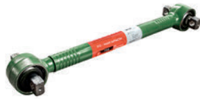
Штанга реактивная LC211010