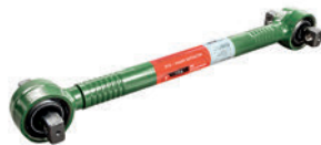
Штанга реактивная LC211014

81.43220.6196 81.43220.6232 81.43220.6233 81.43220-6400 81.43220-6379