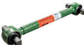
Штанга реактивная LC211006

IVECO 4100 9661 IVECO 4103 5951 IVECO 9847 2466 IVECO 4127 2429 IVECO 41214462 MAGIRUS 41035951 MAGIRUS 41009661 MAGIRUS 98472466 MAGIRUS 41214462